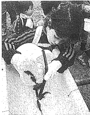
カサゴの稚魚を放流

化、中間育成を行い体長は平均7cmほど。稚魚を傷めないよう岸にスロープを設置し、活魚車からバケツリレーでスロープに沿いに海へと放流した。放流後は、近くにある水産総合研究センター増養殖研究所・横須賀庁舎の協力により、子どもたちが水槽に入ったヒトデやナマコなど、磯に生息する生物とふれあったほか、荒崎公園では同支部と榎ヤマリアが協力し、エギ作り教室やペーパーフィッシング大会などのイベントを実施。参加者は思い思いの色をエギに塗り作品を記念にもらったり、紙で作られた魚をマグネットで釣り上げる