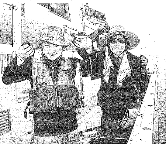
親子参加教室の満悦にご釣果好