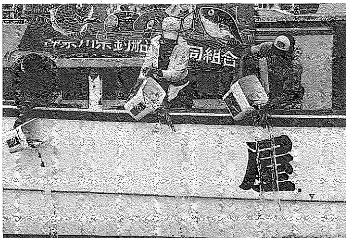
神奈川県釣船業協同組合が実施

当日は、同組合所属船 宿の遊漁船4隻(一之瀬 丸、つり幸、弁天屋、荒 川屋)が横浜市漁協柴支 所(横浜市金沢区)にス タンバイ。午前8時ごろ から稚魚を船に搬入した 後、「八景島シーパラダ イス」近くの海域などへ 移動。メンバーが次々と 稚魚をバケツから海へ放